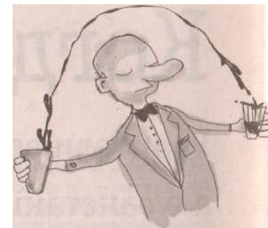
Рис. Олега Пекаря